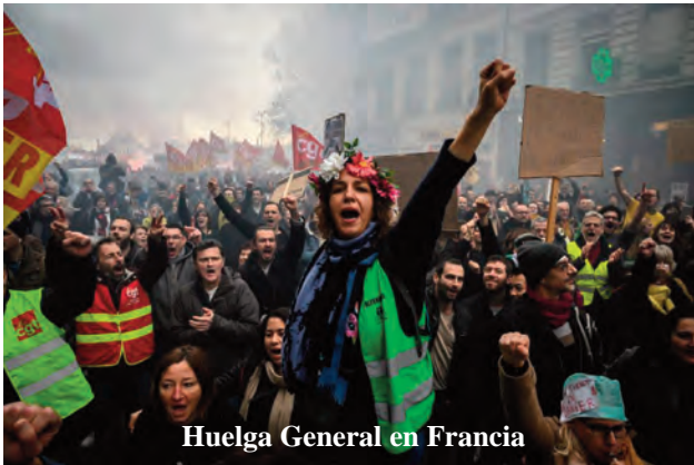
Huelga General en Francia

umento de las relaciones comerciales y los acuerdos políticos entre los países latinoamericanos con Rusia y China se producen a la vez que el Tío Sam pierde su histórica hegemonía en estas latitudes. El hecho de que China esté proponiendo "comprar" la deuda externa de El Salvador, a la vez que ambos países se encuentran trabajando sobre un acuerdo de libre comercio, es precisamente una prueba contundente de ese vínculo. Por otra parte, la reciente asunción de Lula en Brasil augura un mejor entendimiento entre el país lati-