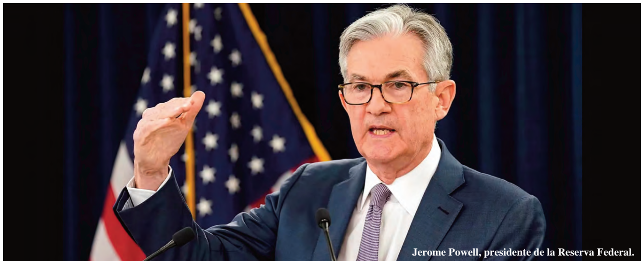
Jerome Powell, presidente de la Reserva Federal.

Si nos preguntáramos cuál es el respaldo de las cuasimonedas virtuales, podríamos contestar que es el mismo de los billetes verdes: NINGUNO. Por tanto, estamos frente a un imperio en decadencia que, además de ser el país más endeudado y tener, paradójicamente, la supuesta moneda más fuerte, ha dejado de ponderar la producción real de bienes y se ha entregado a una especulación financiera como nunca se ha visto en la historia. Una especulación mediante la cual extrae las riquezas del resto de los países con sus guerras de rapiña y las deudas que les "vende" a través de sus organismos de crédito. Como podemos observar, ese orden está resquebrajándose y más temprano que tarde tocará fondo. Las imágenes de la pobreza y miseria que sufren cada vez más personas en las principales ciudades norteamericanas, que en otro momento nos hubiesen remitido a algún país del llamado tercer mundo, dan cuenta de la gravedad de la situación en el estado capitalista más desarrollado. El ámbito político tampoco escapa de la crisis: hace pocas semanas pudimos observar la escandalosa elección del presidente de la Cámara de representantes de Estados Unidos luego de 14 vo-