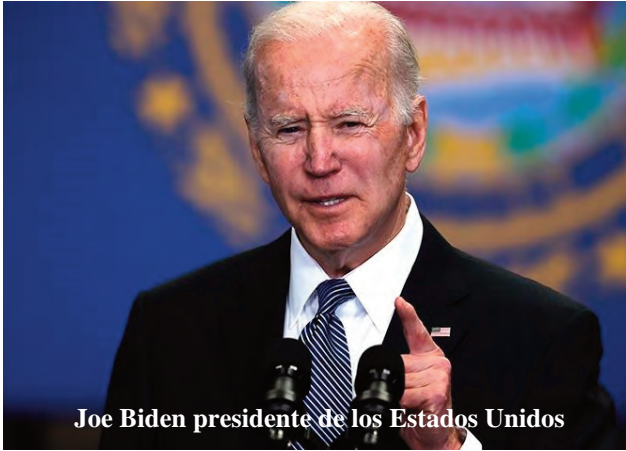
Joe Biden presidente de los Estados Unidos

subterráneas" que pueden albergar tropas, armamento y tanques. Por otra parte, el constante envío de armas, como los misiles Himars por parte EEUU a Ucrania y también el otorgamiento de préstamos al régimen fascista de Kiev siguen demostrando